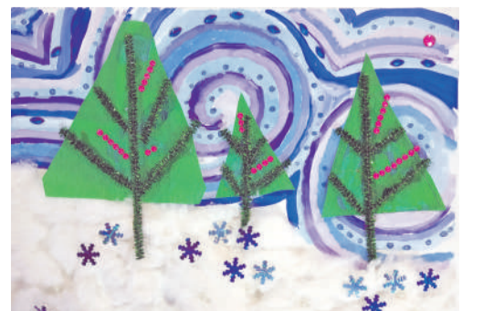
Коллективная работа объединения «Бумажные фантазии»